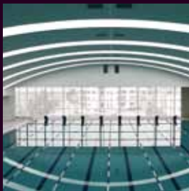
Arch. : Tém hely Ltd & Faraksas és Zarándy Ltd