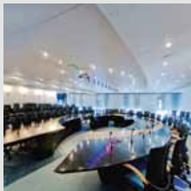
arch. : BEA Raphaël Pistilli