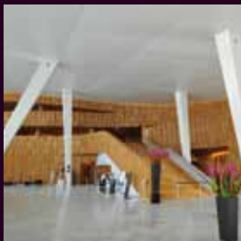
arch. : Snohetta Architects