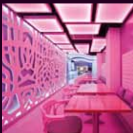
arch. : Lina Gener & Antonio Calvo