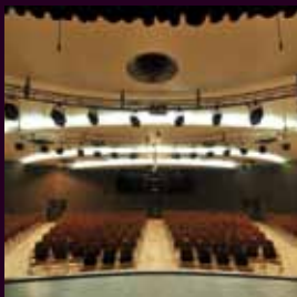
arch. : Ingenierie Spelta Ronjon Laurent