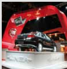
arch.: Projecto Clan S.A.