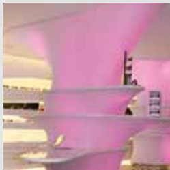
arch. : Marian Caliz & Javier Vzaquez