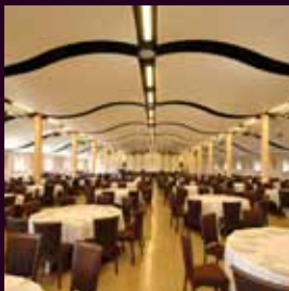
arch. : D.Melgar Noguera & P.Alcover Montaner