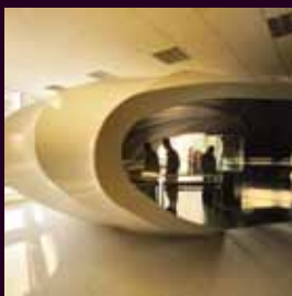
arch. : Pavel Wyslouchil & Tomáš Bílek