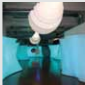
arch. : De Ponte