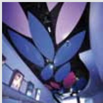
Arch. : Arkitelknik International Consulting Engineers