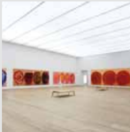
arch.: Sauerbruch Hutton