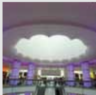
design : Metex