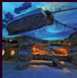
arch. : Alvaro Planchuelo